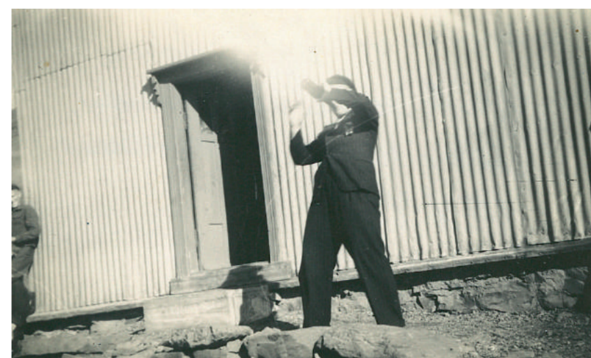
Ólflaskan teygdu á kaupfélagströppunum.