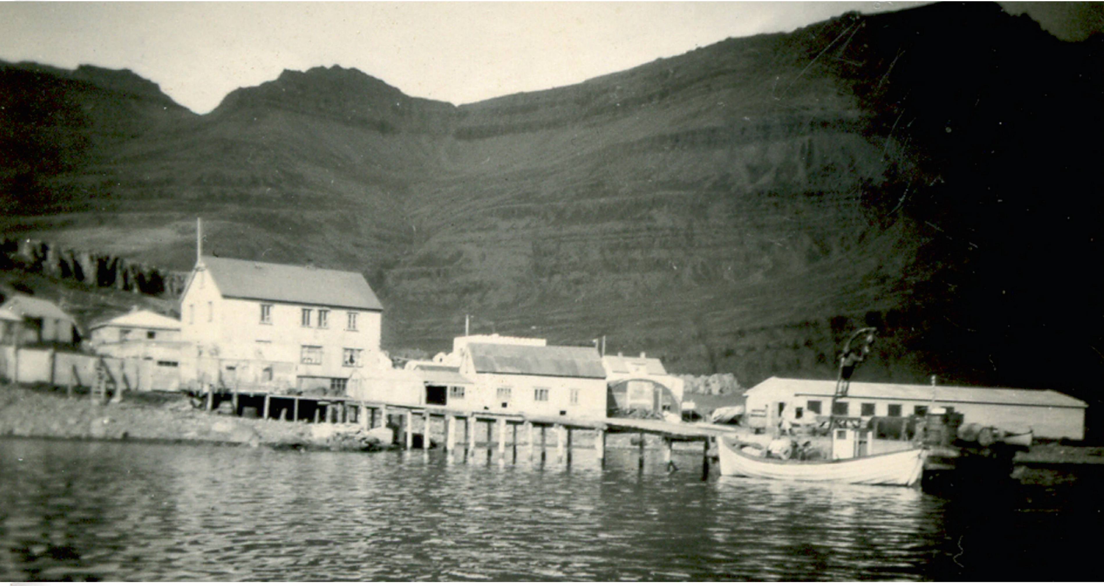
Breiðdalsvík um 1950.