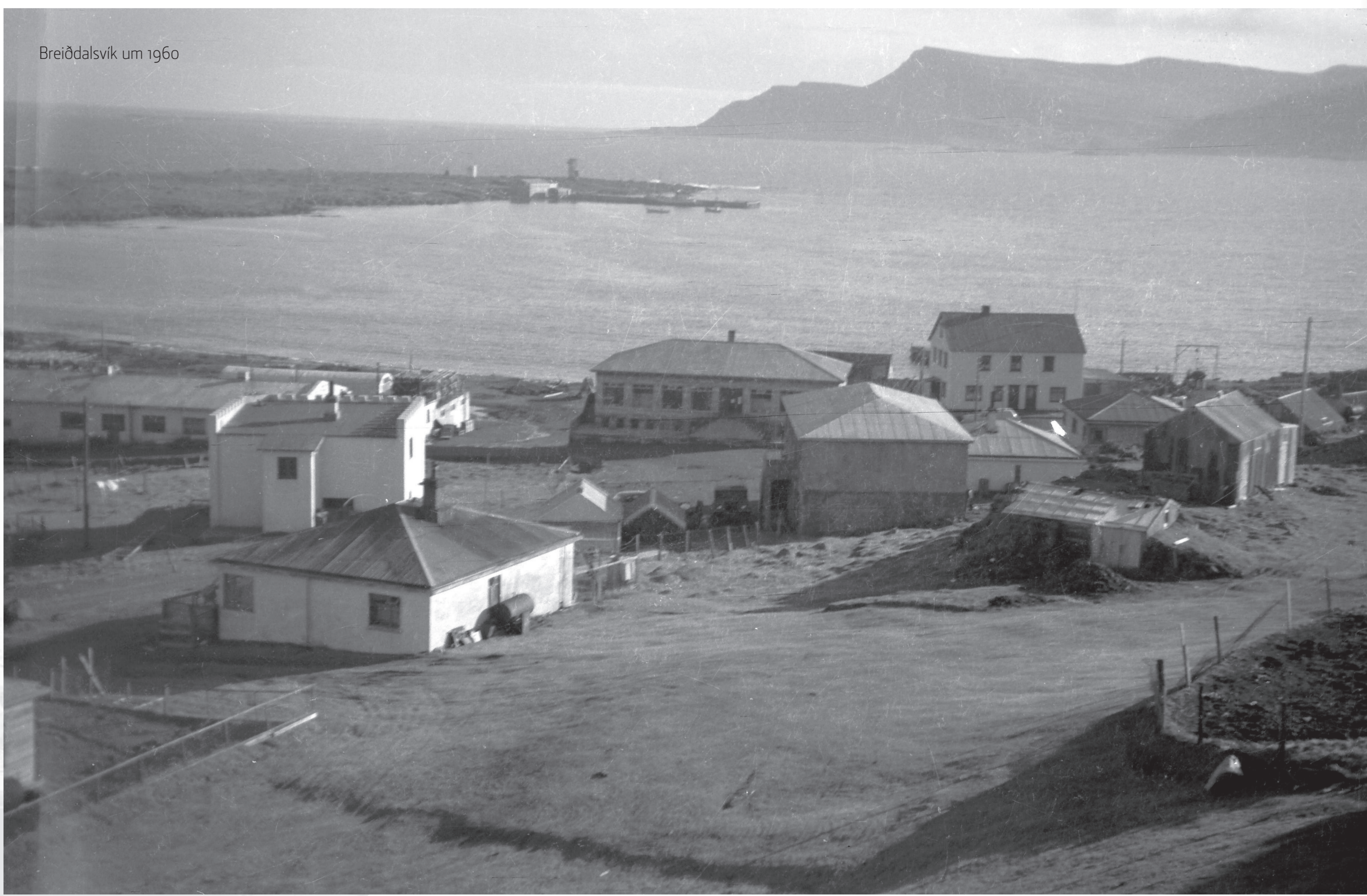
Breiðdalsvík um 1960

Reglulegar útvarpsútsendingar hófust 1930 og munu íbúar á Breiðdalsvík brátt hafa hagnýtt sér þær. Einatt var þó kvartað yfir hlustunarskilyrðum og þótt reynt væri að bæta úr með nýrri endurvarpsstöð í þorpinu um miðjan sjöunda áratuginn heyrðist útvarpið áfram illa inni í sveit og alls ekki þegar komið var djúpt út á Austfjarðamið. Í landi bundu menn nú vonir við nýjasta undur tímans, sjálft sjónvarpið sem þá var í farvatni. Sjónvarpsendurvarpsstöð var sett upp á Óskliði árið 1970. Í kjölfarið fengu margir á Breiðdalsvík sér sjónvarpstæki og „telja að vel sjáist,“ eins og sagði í fréttum.