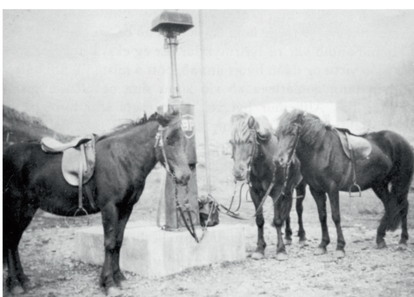
Sá gamli og sá nýi matæst. Við bensindælu kaupfélagsins.