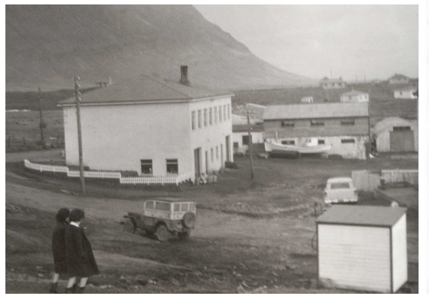
Nýja kaupfélagið fullklárað, hvítmálað og snyrtilegt.