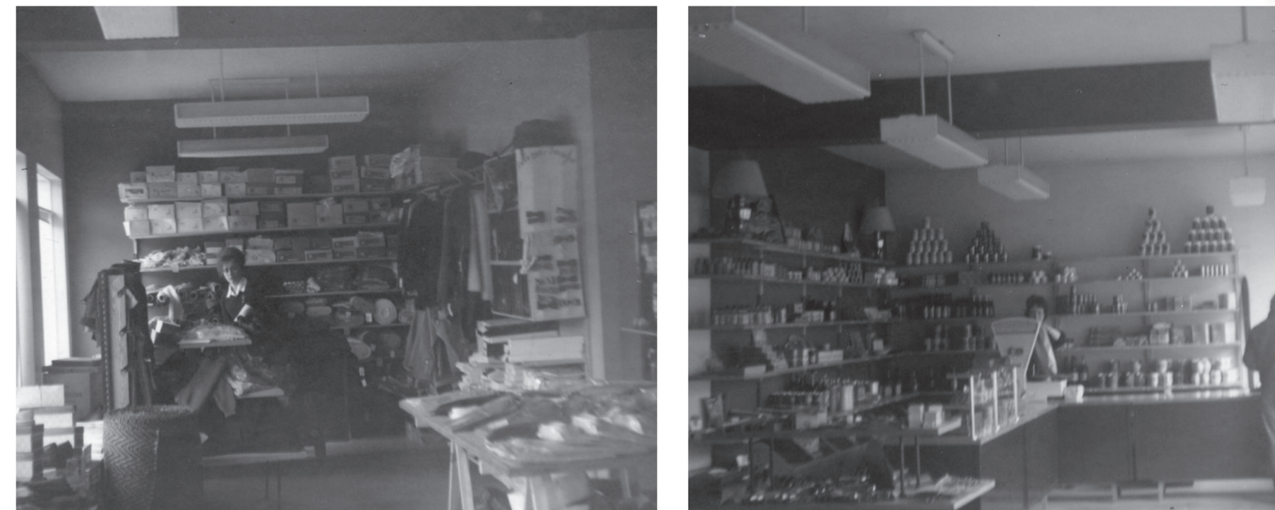
Öll aðstaða batnaði til mikilla muna í nýrri verslun, bæði fyrir starfsfólk og viðskiptavin.